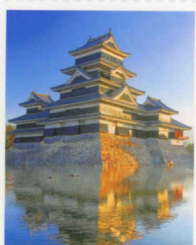
82 NIPPON 松本城 白市郵便