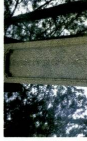
廃仏蕪釈の影響を受け 彫り直された