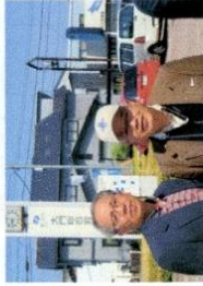
小林記念館館長と神宮司