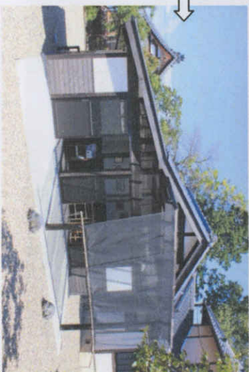
休憩・地域交流棟