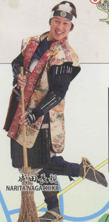
成田長親 NARITA NAGACHIKA

丸墓山古墳 豊臣軍忍城攻め総大将石田三成が忍城を水攻めにした際に陣を置いた場所。結局失敗に終わりましたが、戦国史上に名を残す大規模な水攻めでした。時代はさかのぼって上杉謙信もこの丸墓山に陣を置いたと伝えられています。 日本最大の円墳、さきたま古墳群の中で一番高い古墳頂上から行田の街を眺めてみてください！