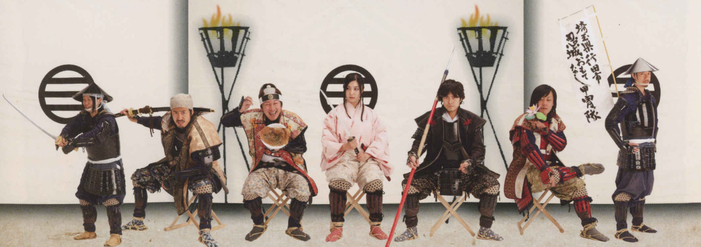
足軽おお AO 柴崎和泉守 SHIBASAKI IZUMINOKAMI 成田長親 NARITA NAGACHIKA 甲斐姫 KAIHIME 正木丹波守 MASAKITANBANOKAMI 酒巻靱負 SAKAMAKI YUKIE 足軽だんべ DANBE

行田の自然と古墳を愛する成田軍の足軽。手ぬぐいと青いものを集めることが好き。足袋のこはぜのように小さくても武将や姫をしっかり支える存在になりたいと思っている。