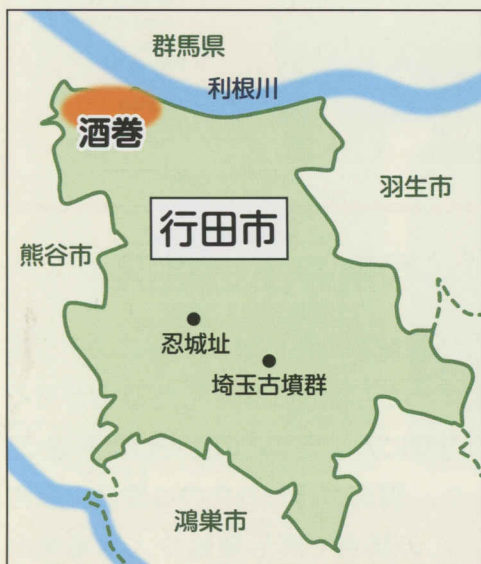
さかまきこふんぐん 酒巻古墳群の位置

酒巻古墳群は、利根川右岸の行田市酒巻地区に6世紀前半～7世紀にかけて展開した大規模な古墳群です。現在までに23基の古墳が確認されています。酒巻地区は、関東造盆地運動による地盤沈降と利根川からの堆積物により、古墳時代の遺跡面は現在よりも約1～1.5m下に埋没しているため、周溝内の埴輪や石室などが残存している古墳が多くあります。出土埴輪が一括で重要文化財に指定された14号墳の他、墓前祭祀の様相が明らかに残る8号墳、埼玉県指定文化財に指定されている器財埴輪などが出土した15号墳などです。