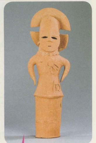
(左) 筒袖の男子埴輪