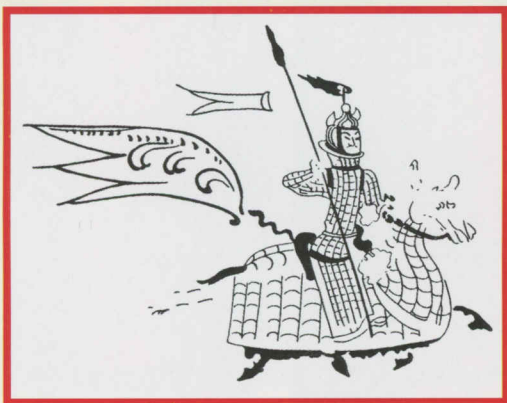
そうえいづか へきが はた きばへい 双楯塚の壁画 旗を立てた騎馬兵 (模式図)

古墳時代には、おとなりの朝鮮半島に あった高句麗や百済、新羅という国から たくさんの文化が日本に伝わったんだ。ほ くとよく似た絵が高句麗の古墳の壁に描か れていたんだよ!